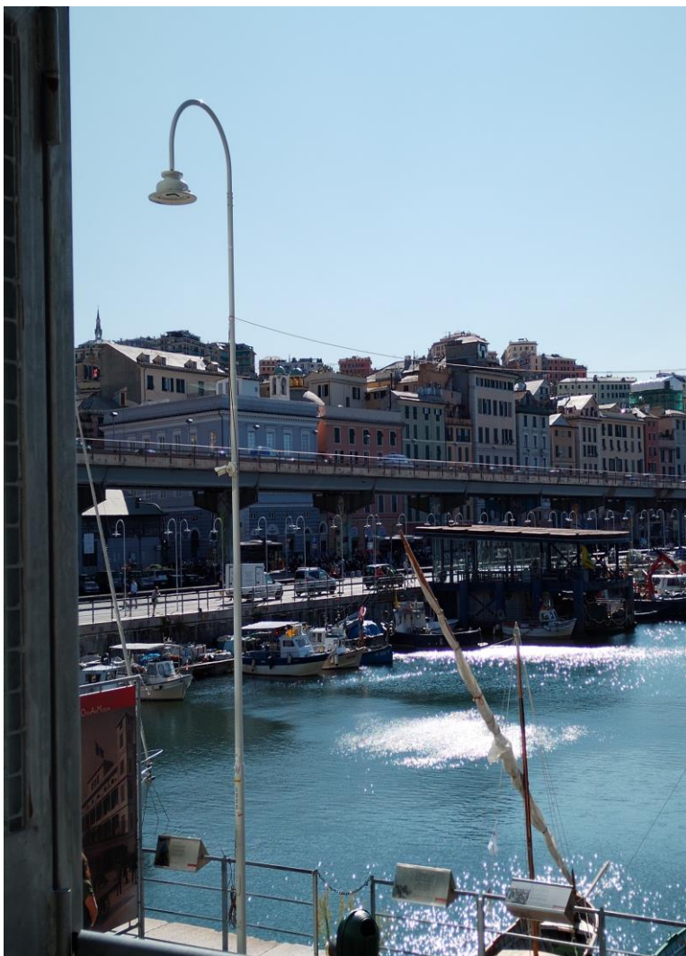
Vista dal DIEC 2023

Il Corso di laurea magistrale in Economia e Management Marittimo e Portuale (EMMP) è unico in Italia per le peculiarità della sua offerta formativa caratterizzata da un'elevata interdisciplinarietà di contenuti specialistici nelle discipline aziendali, economiche, quantitative e giuridiche relative al settore dello shipping e della logistica. Unisce la storica vocazione economica di Genova e della Liguria nel settore dello shipping con un'apertura a esperienze e relazioni nazionali e internazionali.