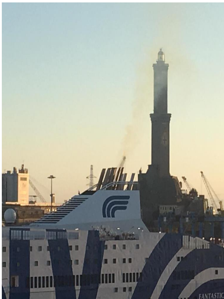
Lanterna di Genova